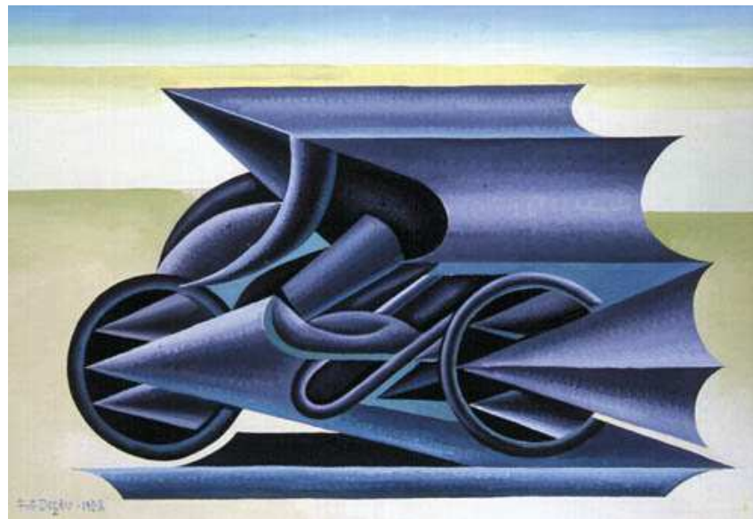
Fortunato Depero, motociclista (1923)