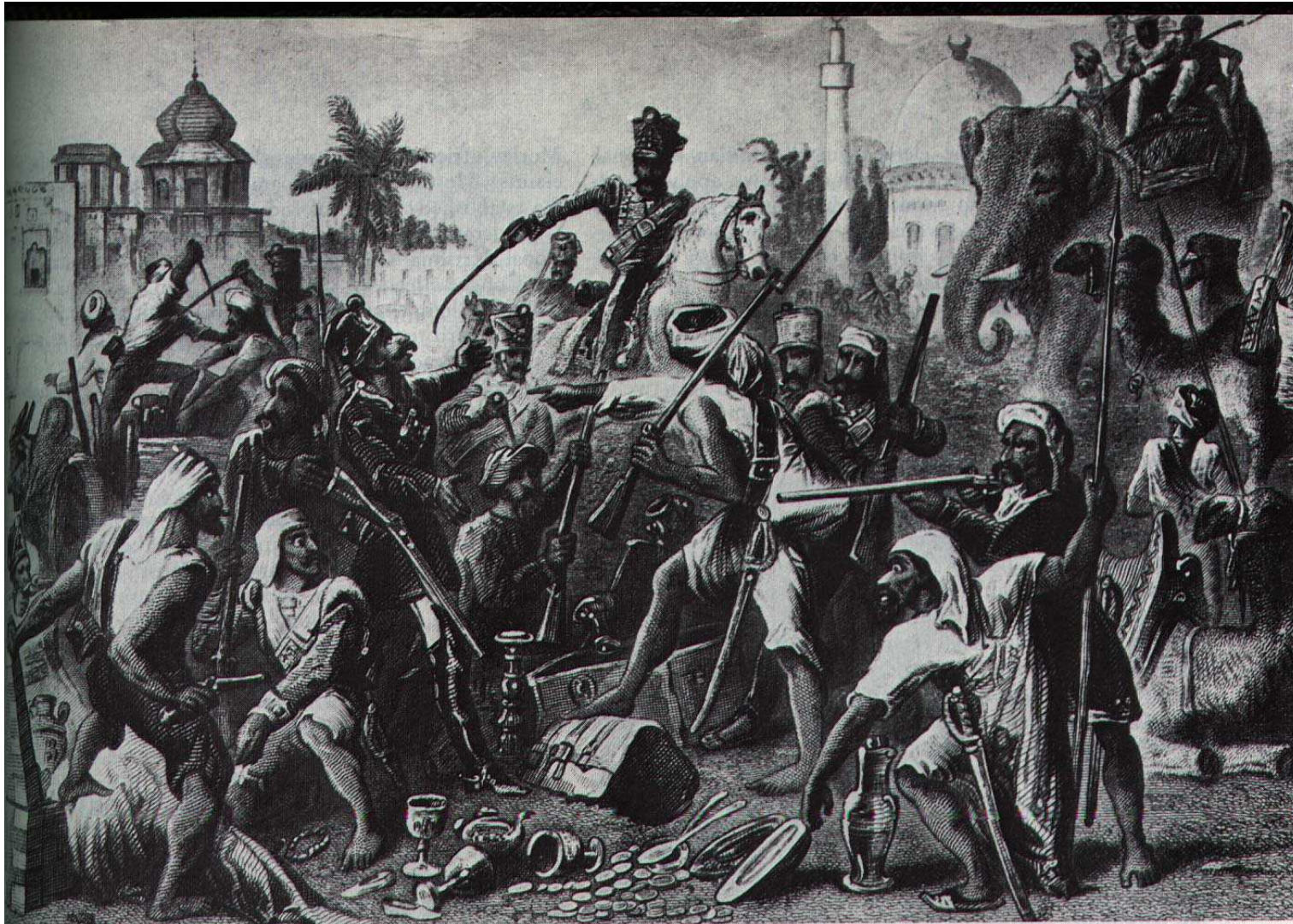
SEPOY INDIAN TROOPS dividing the spoils after their mutiny against British rule (1857-1859).