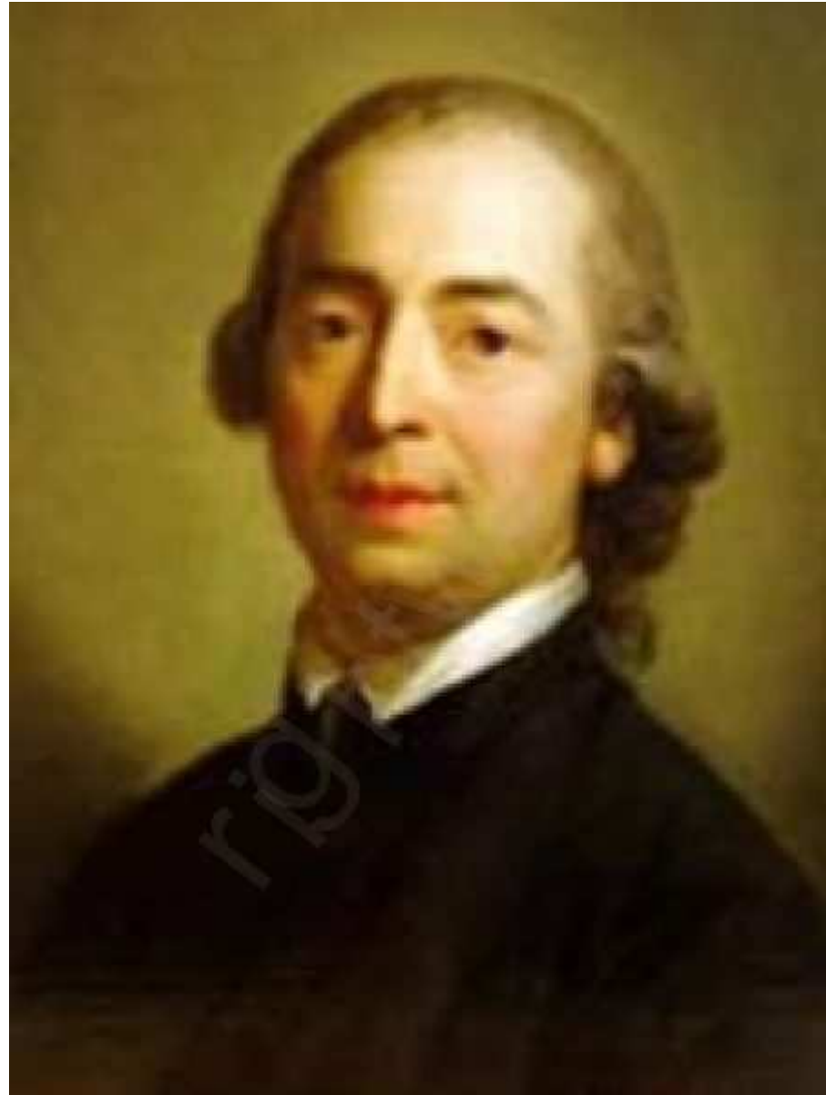
Sociologia dei Processi Culturali e Comunicativi Davide Bennato